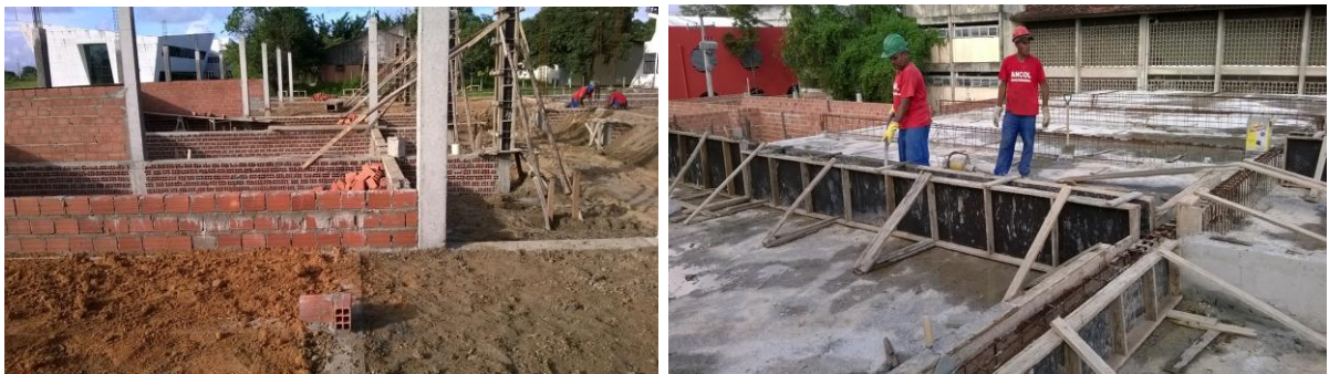
Atividades em campo;